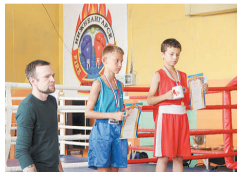
Практически все боксерские поединки